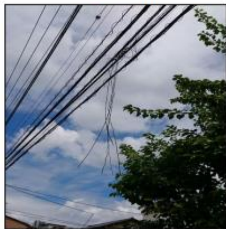
実際の電話線垂れ下がりの様子

ご連絡をいただかずに増改築工事等を実施されると、電話線の垂れ下がり等が発生し、思わぬ事故につながる可能性があります。