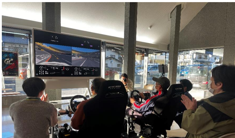
↑白熱する勝負に歓声を上げる参加者