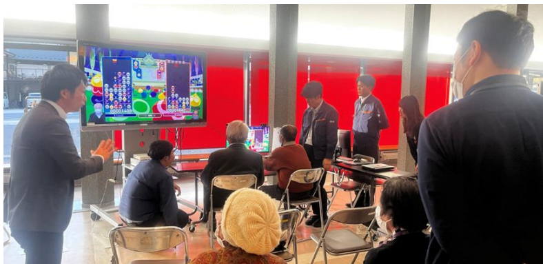
↑サポートを受けながら e スポーツを体験する参加者