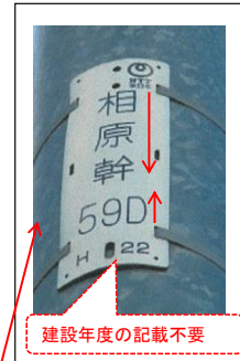
③ 相原幹 59D