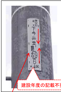
① 下今井支 6R9D