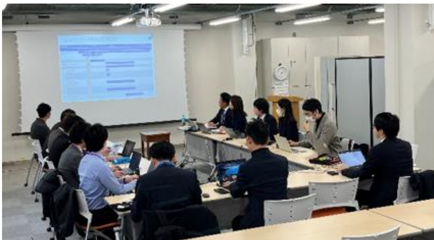
キックオフミーティング模様

<*1> https://www.ntt-east.co.jp/kanagawa/information/pdf/20231220_01.pdf