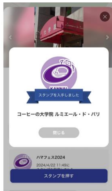
スタンプ入手画面