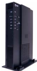
「データコネクアダプタ SIP-TA-200」概観

E-mail : NTT東日本 info-ced@sinoa.east.ntt.co.jp