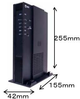
データコネクタアダプタ SIP-TA-200