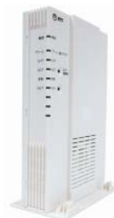
「データコネクアダプタ SIP-TA-3200」概観