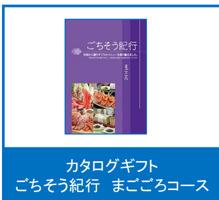
カタログギフト ごちそう紀行 まごごろコース