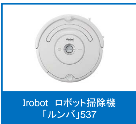
iRobot ロボット掃除機 「ルンバ」537