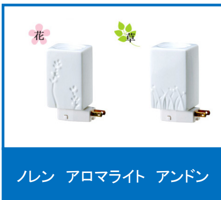
ノレン アロマライト アンドン