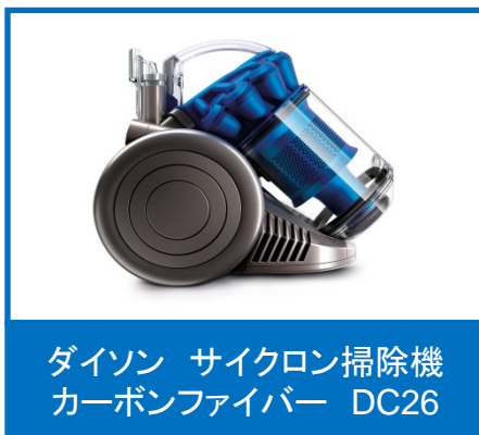
ダイソン サイクロン掃除機 カーボンファイバー DC26