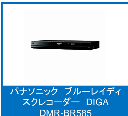
パナソニック ブルーレイディ スクレコーダー DIGA DMR-BR585