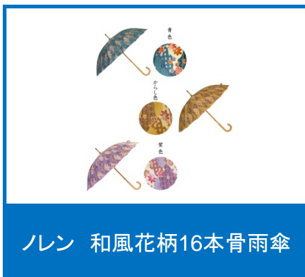
ノレン 和風花柄16本骨雨傘