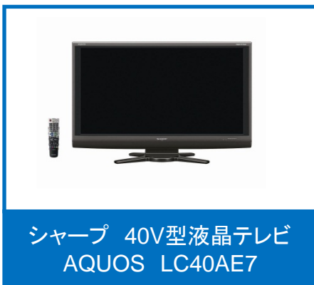
シャープ 40V型液晶テレビ AQUOS LC40AE7