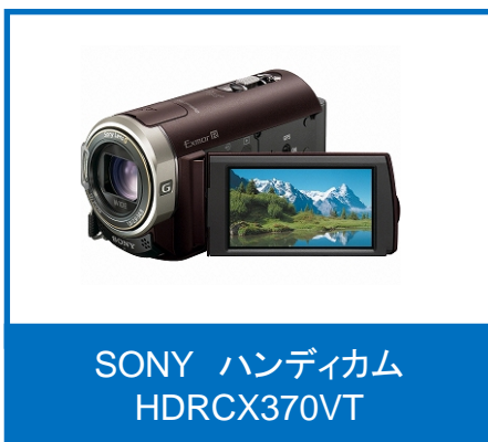
SONY ハンディカム HDRCX370VT